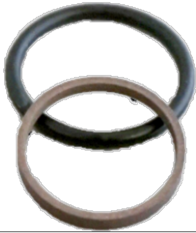
RS1500160-T46N Turcon® Stepseal® m.OR 16,0x20,9x2,2 mm PTFE/NBR