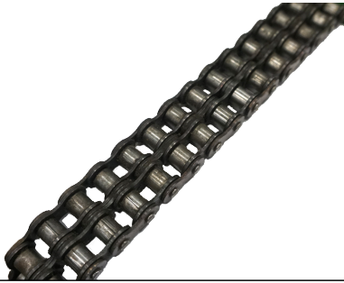
12B-2 Zweifach-Rollenkette ISO 606/DIN 8187 Rollenkette duplex/zweifach, ISO 606 (DIN 8187).