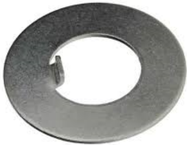
DIN 462 GR. 35 Sicherungsblech DIN 462 mit Innennase Sicherungsbleche DIN 462, mit Innennase, Stahl blank