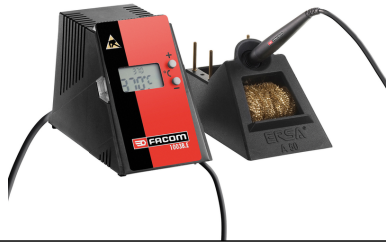
FACOM 1003B.E Lötstation 68W Lötstation 68W